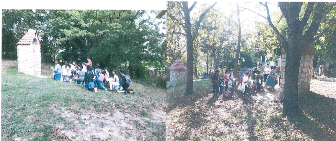
Stációk – Ima