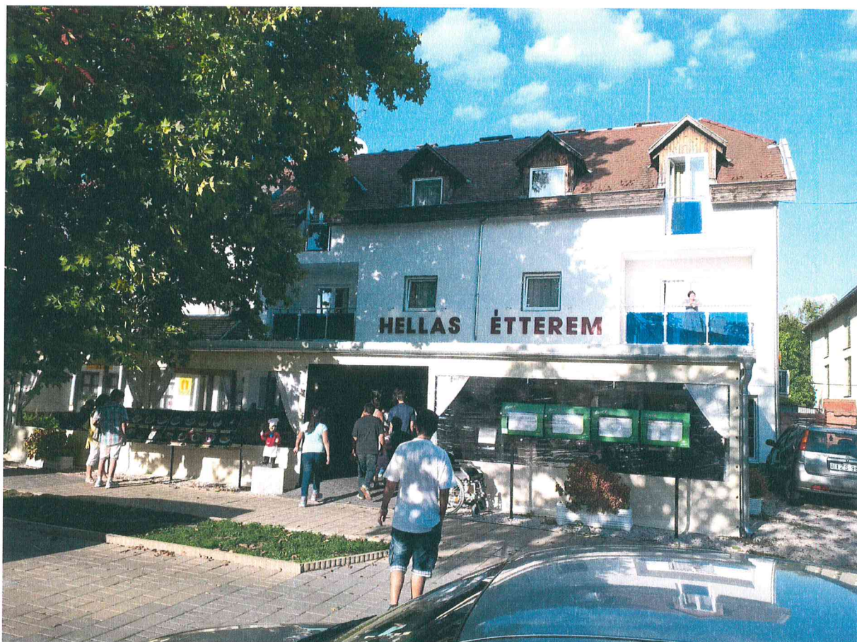
Megérkezés a vacsorára, a harkányi Hellas Étterembe

Hazafelé véve az útirányt Harkányban, a Hellas Étteremben közösen fogyasztottuk el a finom vacsorát.